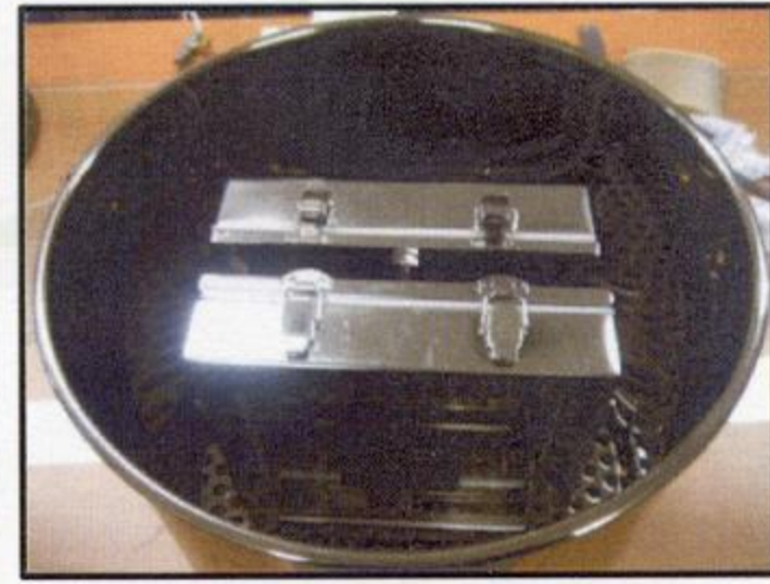
(시험체 설치 모습)